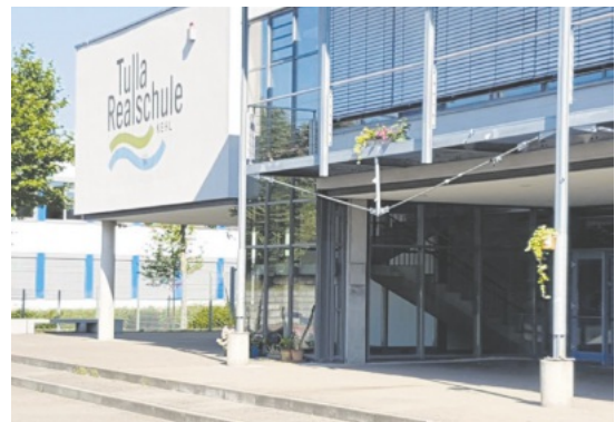
„Abend der offenen Tür“ an der Tulla-Realschule